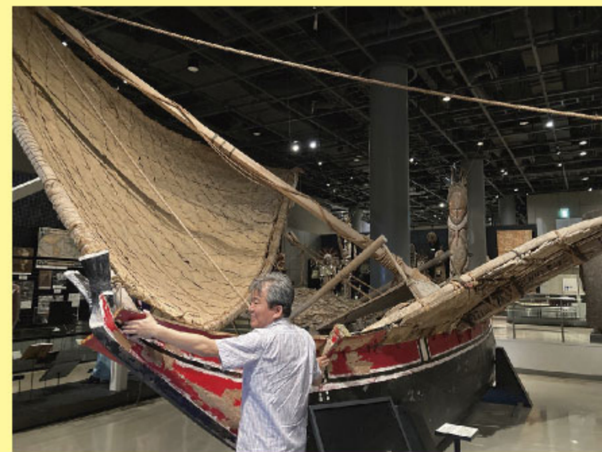
ユニバーサル・ミュージアム連載 カヌー鑑賞