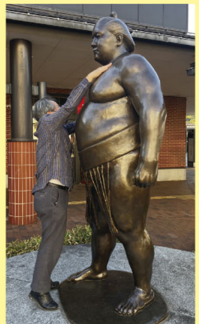
魁皇像 背伸びをして正面から鎖骨をさわる