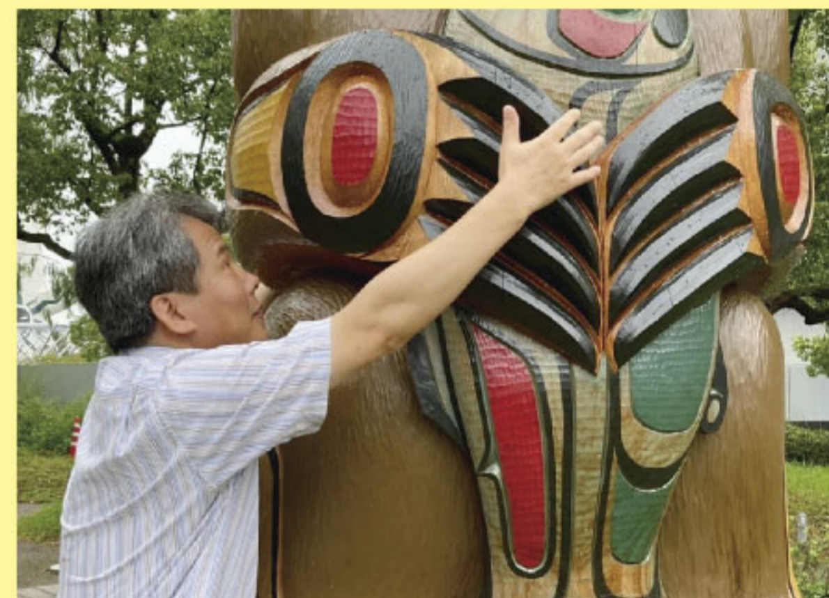
国立民族学博物館の前庭にある トーテムポールをさわる